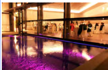
Foto della Serata